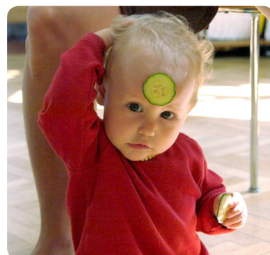
Aufmerksamkeit ist ein wertvolles Gut.