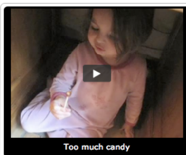
Too much candy